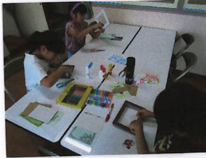
② かざりつけをしてます。