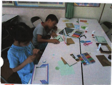
⑤ めっせいがいっています。