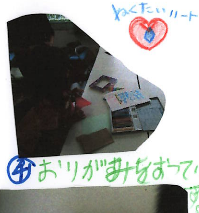
④ おりがみをあてはめていきます。