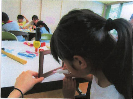
① くぎをうっていきよ。