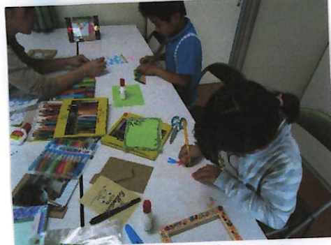
③ 之をかいていきます。