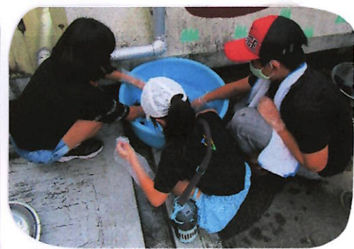
③ ハンカチをすすぎます。