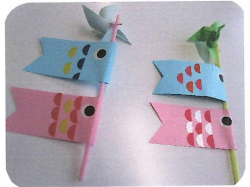
シールをぺたぺた♪上手に見貼れました！