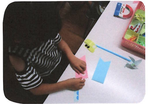
水色とピンクのこいのぼりに、シールで、目やうろこを貼りました。