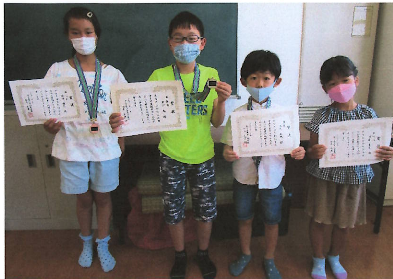
じょうい めい きねん さつえい 上位4名で記念撮影♪