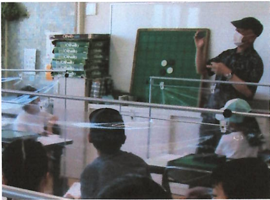
こうし せつめい 講師によるルール説明 からスタート♪