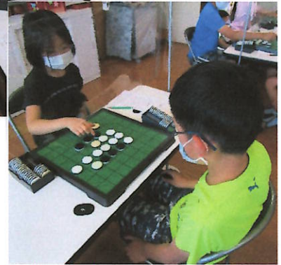
ほうしき し、あい スイス方式による試合で1人4試合おこなわれました。 みんな いっしょうけんめいがんばりました。