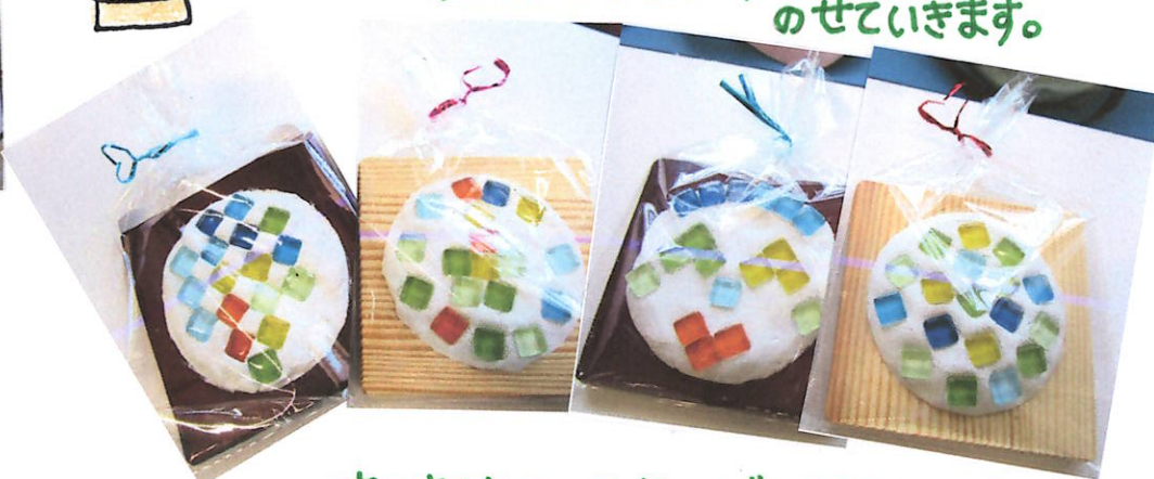
すてきなコースターができました!