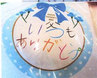
心をこめて、メッセージをかきました。