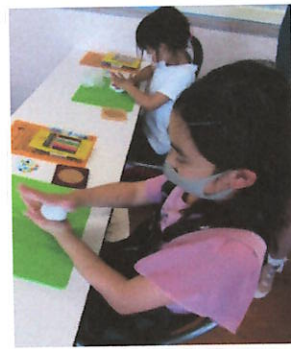
たいらにした紙ねんどを コースターの真ん中に 広げてかぶせます。