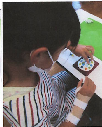
紙ねんどの上にタイルを のせていきます。