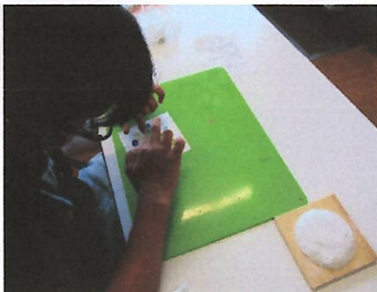
白い紙の上にタイルを のせてイメージします。