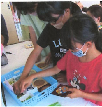
すきなコースターと タイルをえらびます。