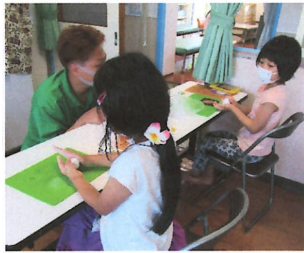
紙ねんどをよくこねて たいらにします。